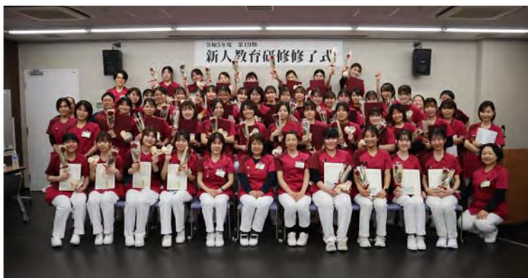
▲研修を終えた看護師たちが記念撮影