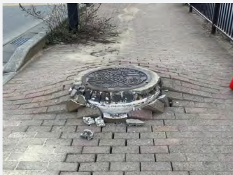
▲未だ震災の爪痕が残る被災地