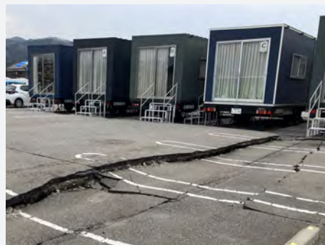
▲北口介護専門職員の活動拠点

2024年3月15日～17日、日本介護支援専門員協会からの派遣にて、石川県「被災高齢者等把握事業」で、輪島市にボランティアとして参加しました。