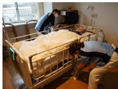
▲ベッドの周りを清掃