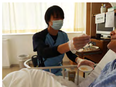
▲患者さんの食事のお手伝い